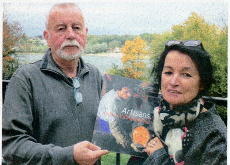
Les artisans du terroir (1999).

Fin des années 90. Le couple réalise un livre sur les métiers français d'autrefois : "Les artisans du terroir". Le photographe tombe sous le charme du Bassigny : « J'y ai trouvé une nature passionnante avec ses forêts, lacs et canaux, près ou champs parfois couverts de coquelicots, son relief vallonné et cette lumière si particulière. L'origine de ces ciels fabuleux à contempler provient d'un phénomène