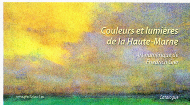
De la photo à l'art graphique.